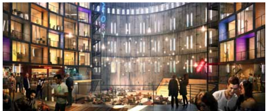
Visionsbild av Gasklocka 1 där det planeras musikhotell.

Ombyggnationen kommer starta 2016 och beräknas vara klart cirka 2020. Förberedande arbeten som markrening och gatuarbeten har redan påbörjats.