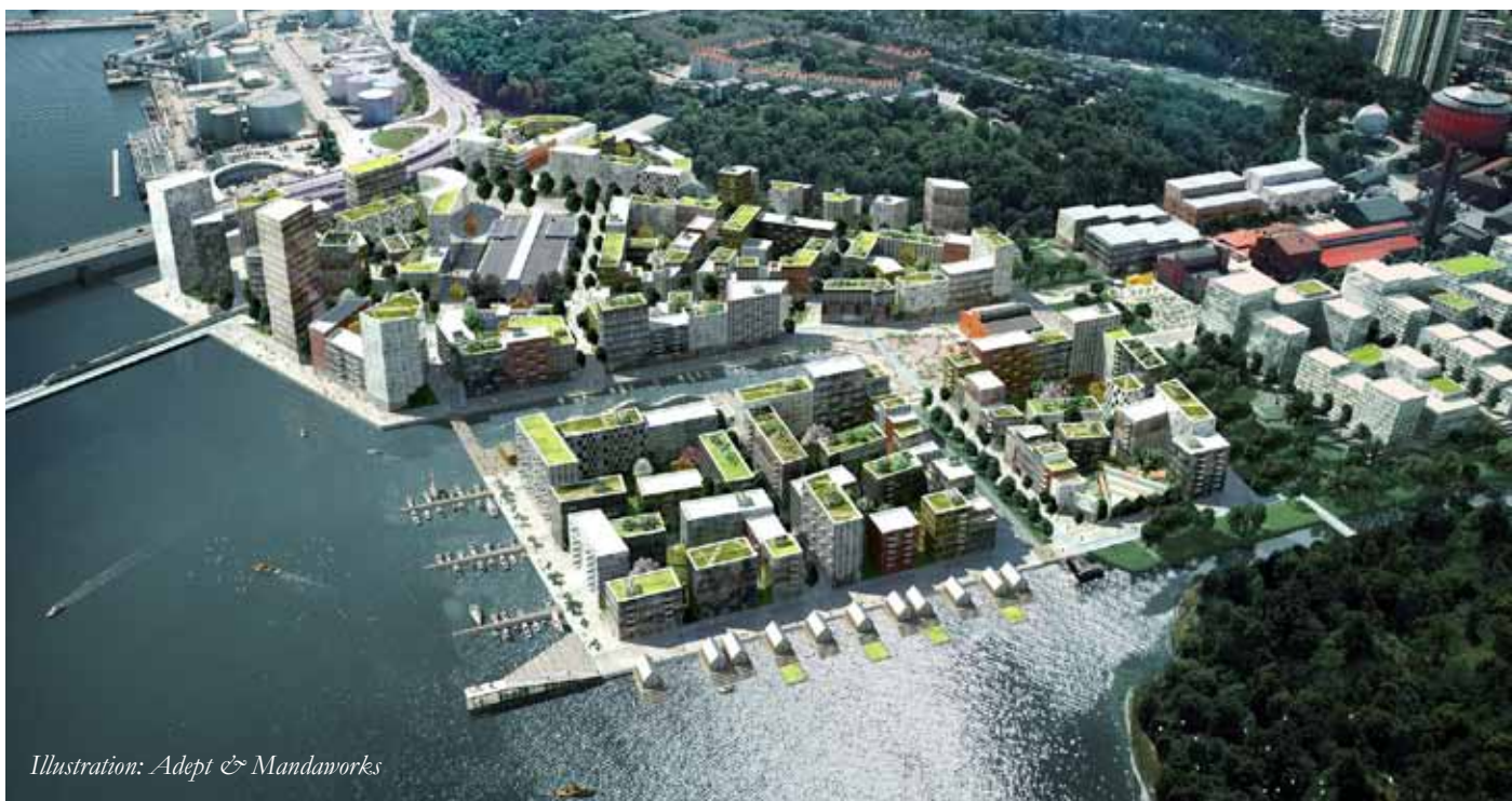
Illustration: Adept & Mandaworks

2 000 nya bostäder och 70 000 kvm kommersiella ytor ska byggas i Norra Djurgårdsstaden. En ö byggs ut i vattnet som möjliggör att fler lägenheter får ett vattennära läge. Stadsbyggnadsnämnden väntas ta beslut om en startpromemoria för planläggning av området Kolkajen-Ropsten den 21 maj.