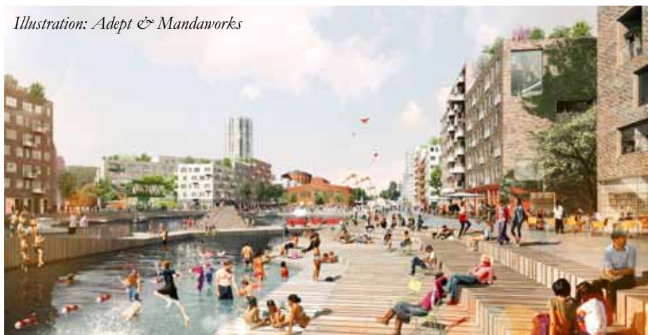
Illustration: Adept & Mandaworks

sina stora grönområden. Ambitionen är att områdets ska bli i det närmaste bilfritt.