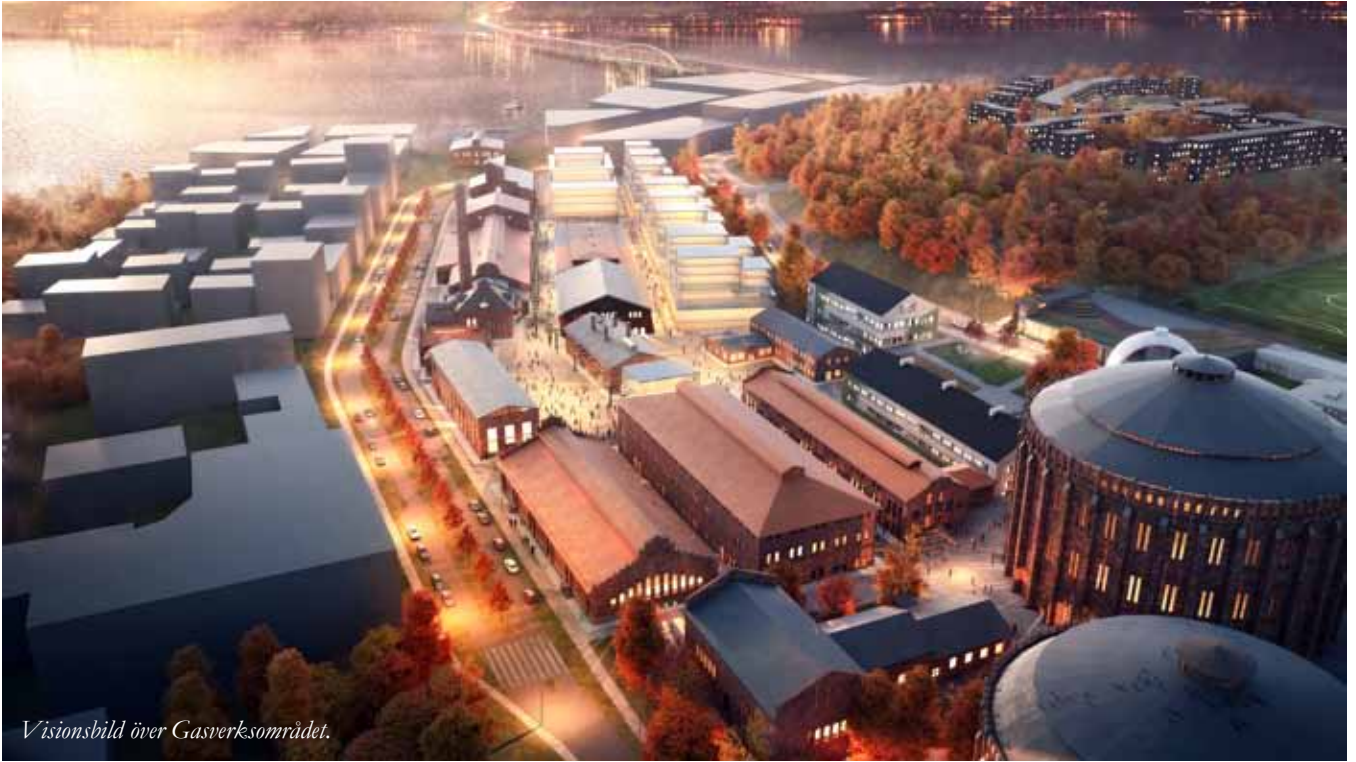
Visionsbild över Gasverksområdet.

Gasverket har i mer än hundra år bidragit till stockholmarnas vardag: från ljus till stadens gatlyktor till värme i hemmens spisar. Nu sätts det gamla industriområdet i ett helt nytt sammanhang.