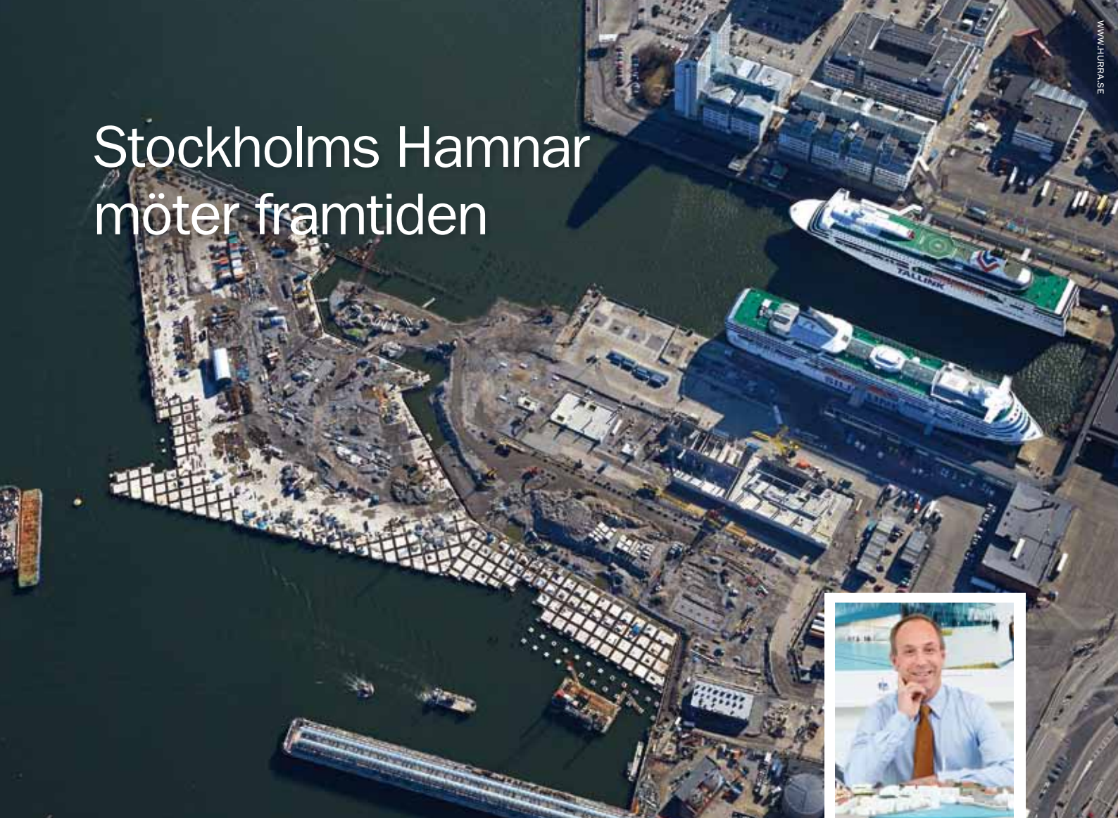
Värtahamnens utbyggnad, mars 2015. Alla pålar är nu på plats.